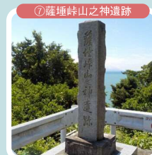
⑦薩埵峠山之神遺跡