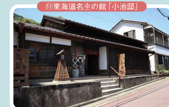
⑪東海道名主の館「小池邸」

由比駅から薩埵峠の登り口までの倉沢寺尾地区は旧家が多く、くぐり戸、格子づくりなどの重厚な構えから江戸時代の面影が忍ばれます。