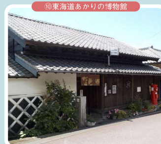
⑩東海道あかりの博物館