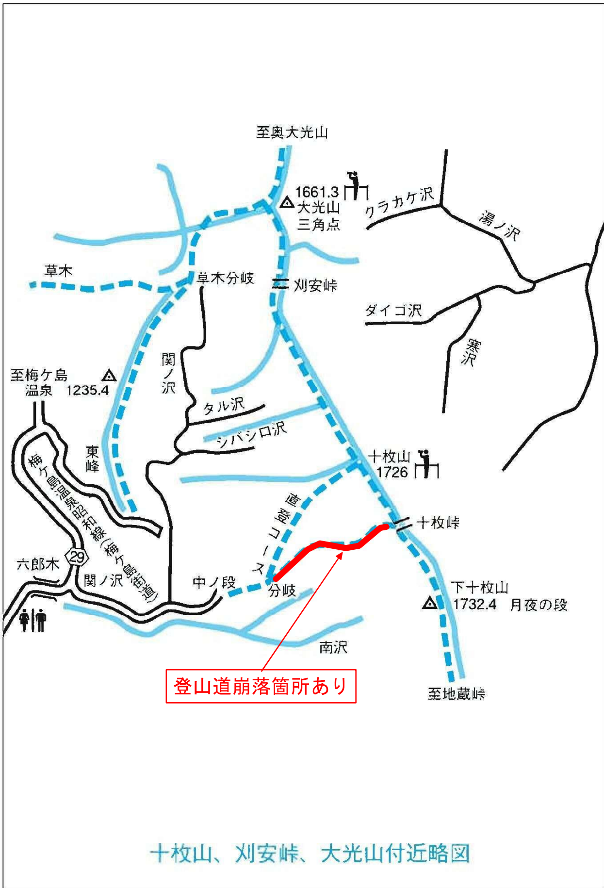
十枚山、刈安峠、大光山付近略図