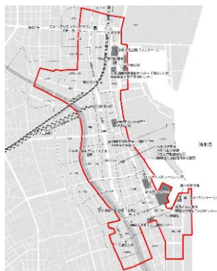
中心市街地の区域 (清水地区)