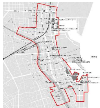
中心市街地の区域 (清水地区)