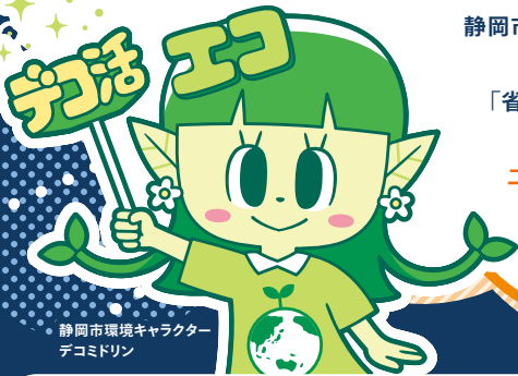
静岡市環境キャラクター デコミドリ

静岡市では、脱炭素につながる新しい豊かな暮らしを創る 国民運動「デコ活」の一環として、 「省エネ家電買換えキャンペーン」を推進しています。 この機会に、地球温暖化の原因となる 二酸化炭素の排出量や電気代の削減につながる 省エネ家電の買換えを検討してみませんか?