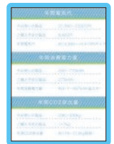
スマートフォンでの比較画像