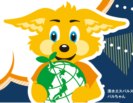
清水エスパルス バルちゃん