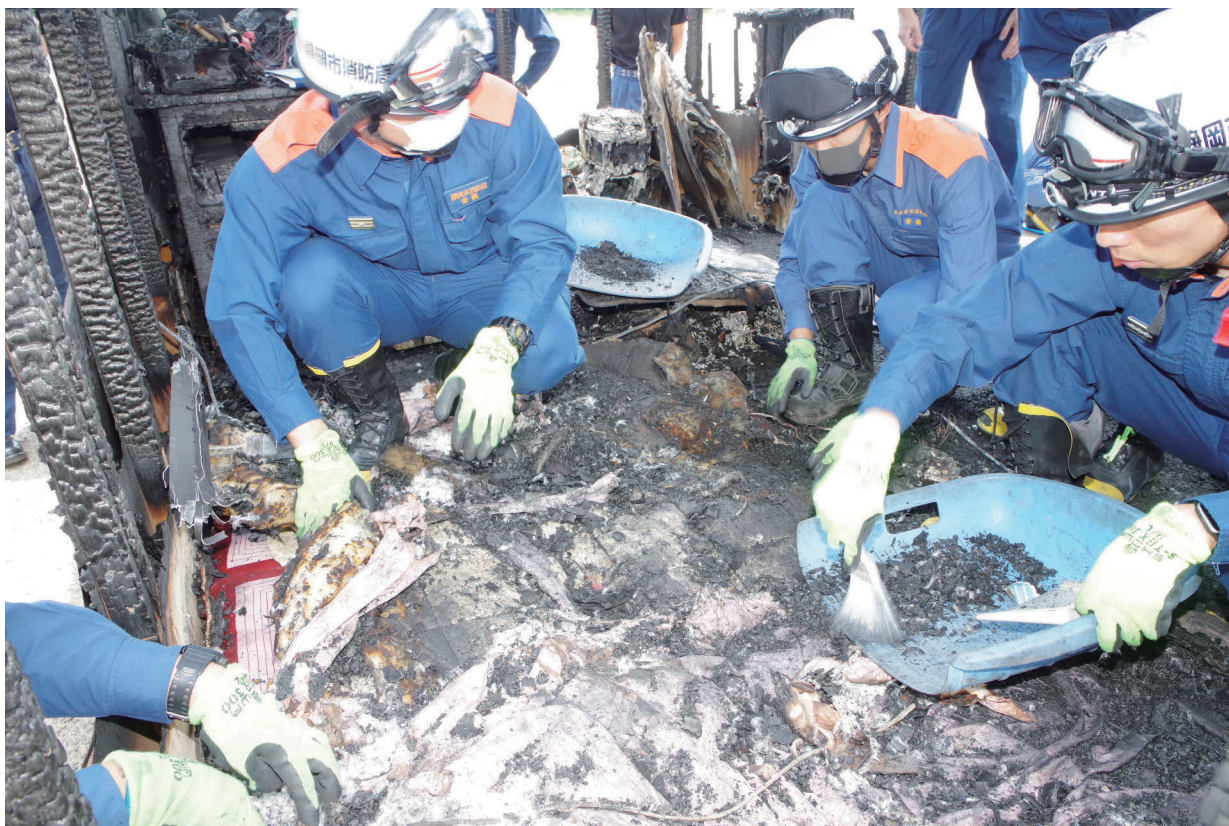
火災調査アドバイザー認定講習（模擬家屋を使用した現場見分要領）