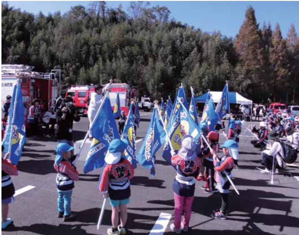
平成 30 年度「あつまれ！ちびっこ消防隊」清水区支部大会の様子