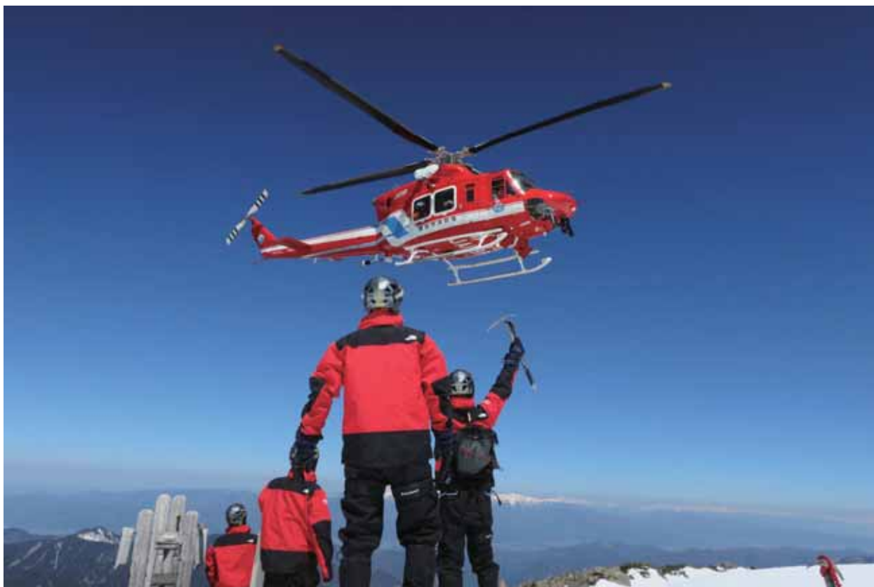
山岳救助隊春山訓練