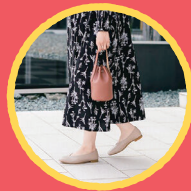
前田工業 Recipe & PennyLane 革小物・バッグ・靴 ワークショップ(ねこキーホルダー)