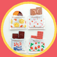
チョコレート Conche チョコレート チョコレート菓子等