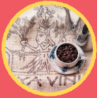
自家焙煎珈琲 いつもはフィッシャーマン ハンドドリップコーヒー、珈琲豆、 ドリップバッグ