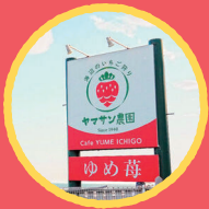
ヤマサン農園 ゆめ苺 バック入りいちご、いちご飴、 ぜんざい(いちご入り)