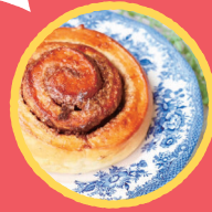
シリケカフェバケリ (kirkekafebakeri) 北欧ノルウェーの 全粒粉たっぷりのパン