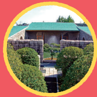
静岡市立 芹沢銈介美術館 〈せりびワークショップ〉 小絵馬を作ろう! ※ワークショップの開始時間までお待ち いただく場合がございます。