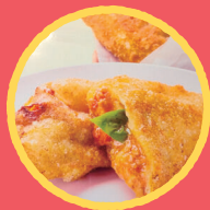
MATUSAN CAFE カルツォーネフリット ミートポテト、玉こんにゃく、芋煮 等