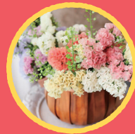
Flower & Leaf log ドライフラワー作品販売と ワークショップ