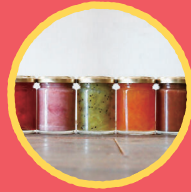
Chipakoya 季節のジャム、果実のコンポート、 焼き菓子等