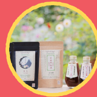
日本平紅茶 自然栽培の茶葉で作った紅茶、 旬のジャム