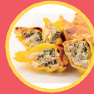
広東料理 棗 しずまえ用宗黄金餃子