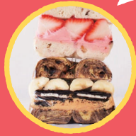
MOUNTAIN BAKE ベーグル、サンドイッチ、 焼き菓子