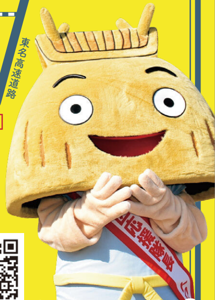
駿河区応援隊長 トロペー

開催の可否に関するお問い合わせは、 静岡市コールセンター(054-200-4894)まで (平日:午前8時から午後8時まで/土日祝日:午前8時から午後5時まで)