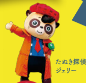
たぬき探偵 ジェリー