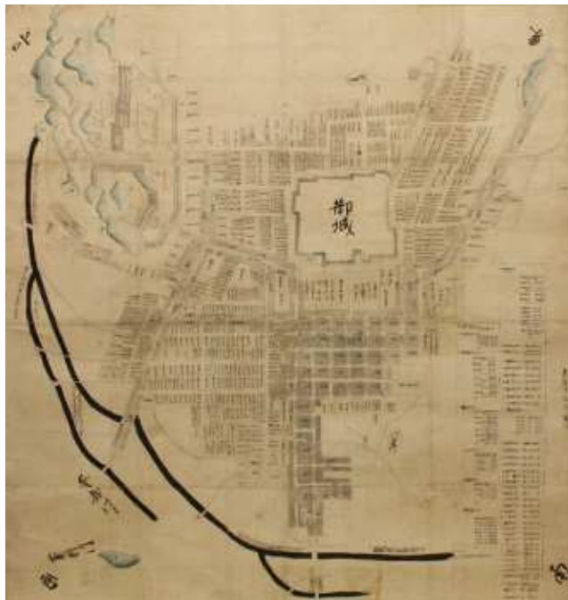
家康公在城時の駿府城下町を描いたとされる絵図「駿府城下町割絵図」(静岡市蔵)