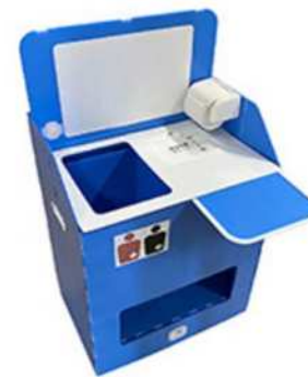
オストメイト対応トイレ