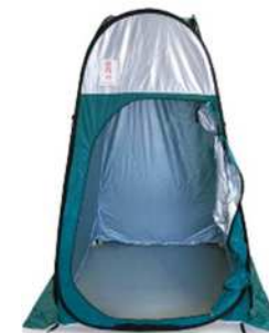
テント(簡易トイレ用)