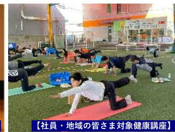
【社員・地域の皆さま対象健康講座】