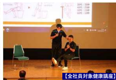
【全社員対象健康講座】