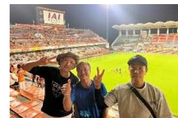
清水エスパルス観戦