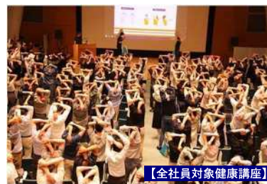
【全社員対象健康講座】