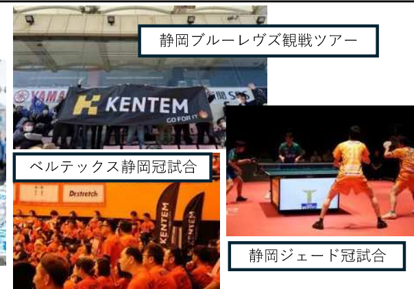
ベルテックス静岡冠試合