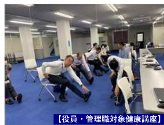
【役員・管理職対象健康講座】