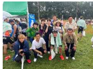
しずまエトリアスロン応援