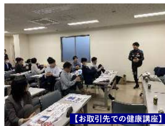
【お取引先での健康講座】