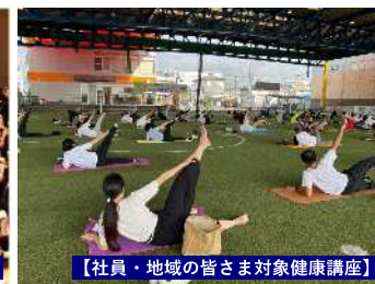
【社員・地域の皆さま対象健康講座】