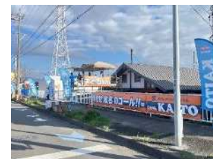
静岡マラソンエイド設置