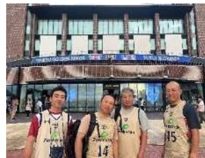
沖縄アリーナ観戦