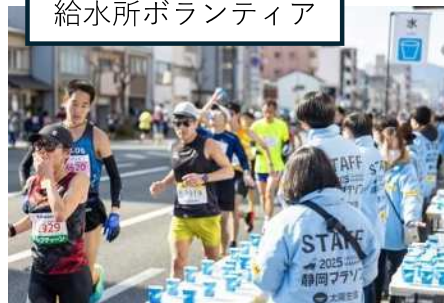
静岡マラソン2025 給水所ボランティア