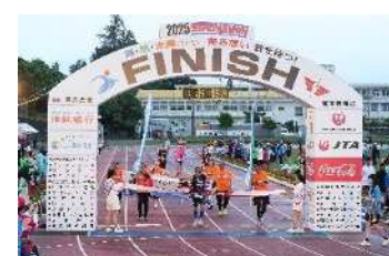
宮古島トライアスロン応援