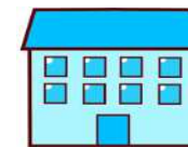
近くの健康相談窓口

引き続き、身近な健康相談窓口で健康づくりに関する相談ができます。 更に、これからは区役所に来所した際にも健康相談ができるようになります。