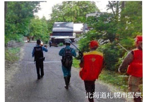
対応に当たる銃器所持者等