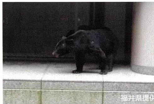
建物の中庭に侵入したツキノワグマ