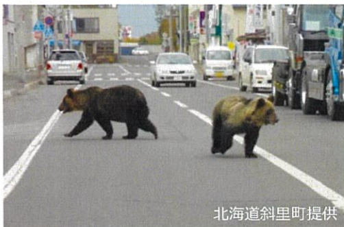
市街地に出没したヒグマ