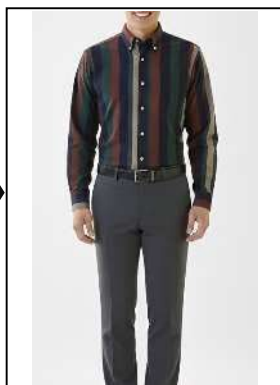
派手な色や柄の シャツ