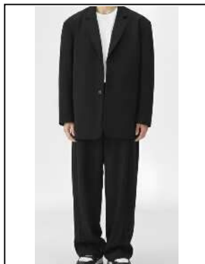
肩幅、身幅に合っていない上着、 ワイドなスラックス等のオーバー サイズのスーツ