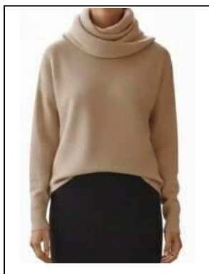
タートルネックでも 襟元が大きいもの