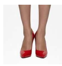
色・デザインが派手な ハイヒール