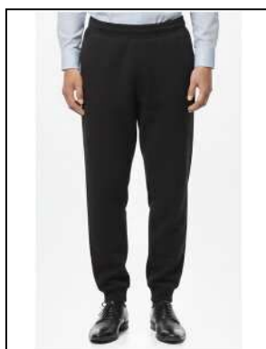
スウェットパンツ