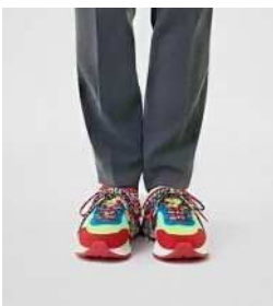
色・デザインが カジュアルすぎる スニーカー