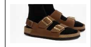
バックベルトはあるが、 カジュアルすぎる サンダル（クールビズサンダ ルとして認められないもの）