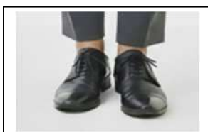
素足が出てしまう丈 の短い靴下