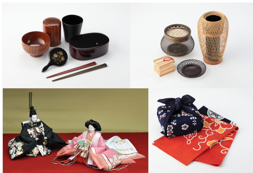
図 静岡市の伝統工芸品類例

そこで、域外に居住する者の知識及び技能を活用して本市の地域産業の活性化と後継者の育成を図るとともに、その定住を促し、地域産業の持続可能な発展に資するため、「地域産業地域おこし協力隊員」を募集します。