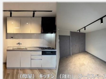
(母屋) キッチン (離れ) ワークスペース