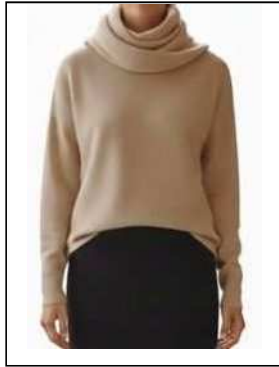
タートルネックでも 襟元が大きいもの