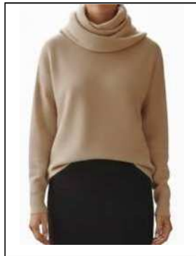
タートルネックでも 襟元が大きいもの