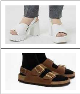
バックベルトはあるが、 カジュアルすぎる サンダル (クールビズサンダ ルとして認められないもの)