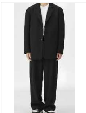
肩幅、身幅に合っていない上着、 ワイドなスラックス等のオーバー サイズのスーツ