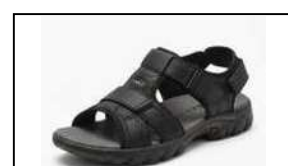
クールビズサンダル (バックベルトがあり、フォーマルな色合いのもの)