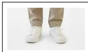
スニーカー (白色、黒色、茶色等の落ち着いた色で柄がないもの)