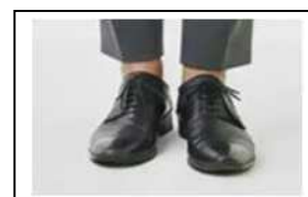
素足が出てしまう丈 の短い靴下