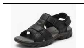
クールビズサンダル (バックベルトがあり、フォーマルな色合いのもの)