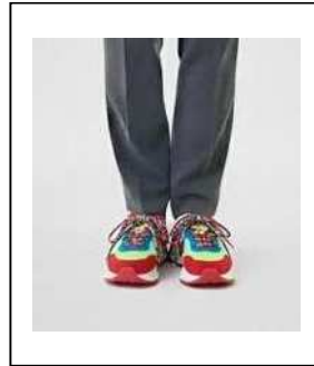
色・デザインが カジュアルすぎる スニーカー