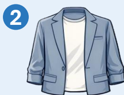
Tシャツ (ジャケット着用)