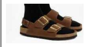
バックベルトはあるが、 カジュアルすぎる サンダル (クールビズサンダ ルとして認められないもの)