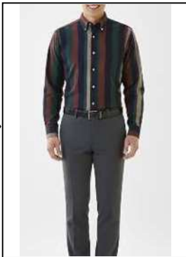
派手な色や柄の シャツ