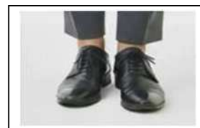
素足が出てしまう丈 の短い靴下