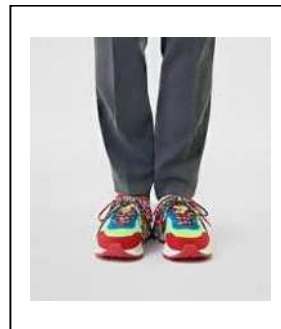
色・デザインが カジュアルすぎる スニーカー