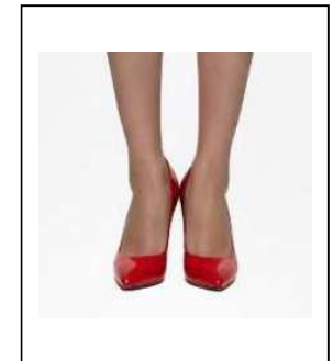
色・デザインが派手な ハイヒール