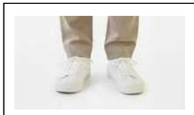
スニーカー (白色、黒色、茶色等の落ち着いた色で柄がないもの)