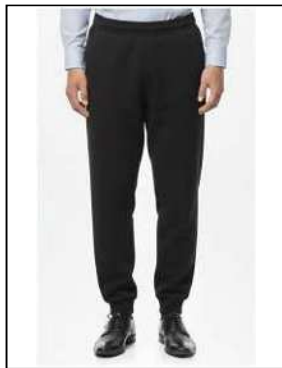
スウェットパンツ