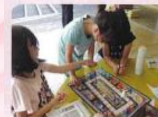
自由遊びの様子 ボードゲーム