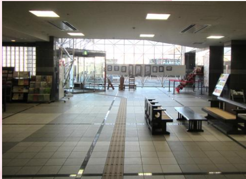
ラウンジ 自由に利用できる打ち合わせスペース。 カフェ等の飲食可能スペースとして、 民間資金の活用の可能性を検討。