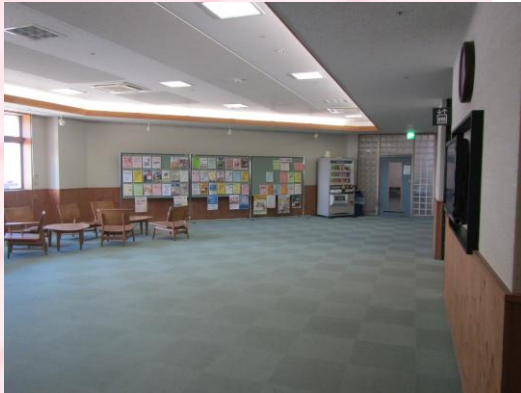
展示ロビー・ラウンジ 多目的な用途での利用を検討中。