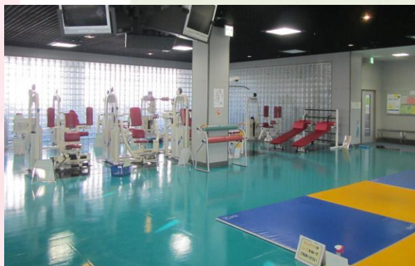
現状、トレーニングルーム部分を改修予定。