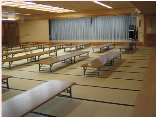
大広間。 ステージ、音響、映像装置があります。