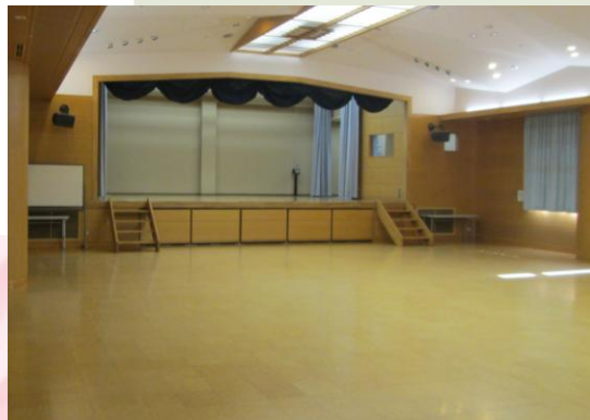
ホール 定員150人。ステージ・映像・ 音響設備あり。