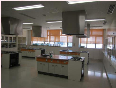
貸室 定員8人から70人までの大きさ さまざまな貸室（調理室、和室、 会議室）が全7部屋。