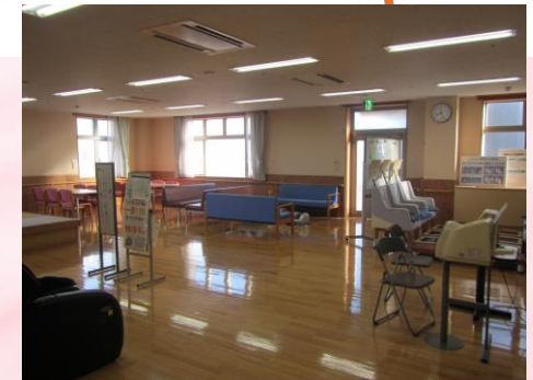
各居室 くつろぎ、語らいの場として自由に 利用が可能。