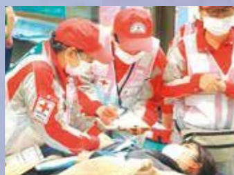
仮想傷病者の状態を確認する救護班