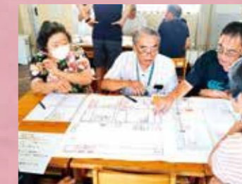
ひなんじょたいけんでのグループワーク

静岡県支部では、地域の防災力向上を支援するため、防災や減災に関する知識や技術を学べる「赤十字防災セミナー」を自治会等を中心に県内各地で開催します。