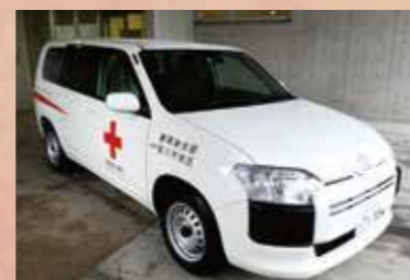
災害救護用自動車

また、市町への支援として発災時に避難所の状況確認やニーズを調整する職員派遣のための災害救護用自動車や、被災者へ迅速に救援物資をお届けするための救護用倉庫を更新します。