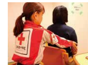
リラクゼーションを行うこころのケア要員

これらの活動は、皆様からのご支援により続けることができます。引き続き、赤十字活動資金にご協力をお願いいたします。