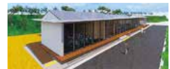
体験学習施設(イメージ)