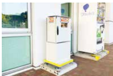
施設の屋外に設置されたAED

市民の命に直接関わるため、24時間使用可能な場所への設置が望ましいと考える。設置場所の確保や風雨対策等の課題があるが、他市の事例を参考に設置を進めていく。