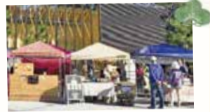
みほしるべ土曜市場