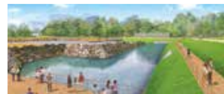
天守台野外展示施設(イメージ)

駿府城跡天守台の野外展示施設や体験学習施設を整備することで、市民が誇りと愛着を抱くまちづくりを進めるとともに、誘客を促進し、地域経済を活性化させます。