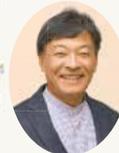
静岡市長 難波喬司

静岡市の経済活動を活性化させる起爆剤となるアリーナは、プロスポーツや音楽の熱狂を生み、多くの人が憧れ、訪れたいまちの拠点となります。アリーナを核とした魅力的なまちづくりを進めていきますので、ご期待ください。