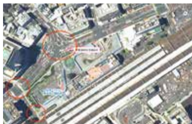
平面横断化(イメージ)

JR静岡駅北口の国道1号交差点平面横断化に向けて、交通への影響を検証するための社会実験実施に向けた検討を行います。