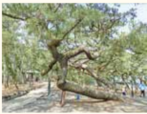
樹形が直角に屈伸したマツ※

松原を散策していると、不思議な形をしている老齢松に出会ったり、切り株から発生しているキノコを見つけたりと、知的好奇心をくすぐられる発見があります。今回の展示では、そんな三保松原に関するふしぎな雑学を写真・標本で紹介いたします。