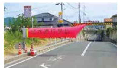
アンダーパスの入口に設置する交通遮断機 (イメージ)

低い道路の入り口に冠水発生を感知して、自動で通行止できる交通遮断機を整備することにより、冠水道路への車両進入を防止し、市民の生命・財産を守ります。