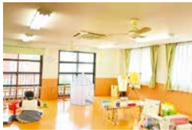
葵病児・病後児保育室の様子

チラシや子育て応援総合サイトなどを通じて周知している。6年4月からは、保育室の空き情報を市ホームページで公開し、6年度中にスマートフォンでの予約システムを導入する。今後もICT化を進め、社会の大きな力と知を活かし、利便性を向上させていく。