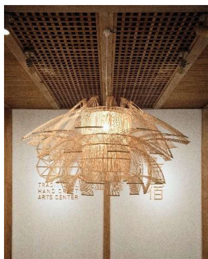
駿府の工房 匠宿エントランス