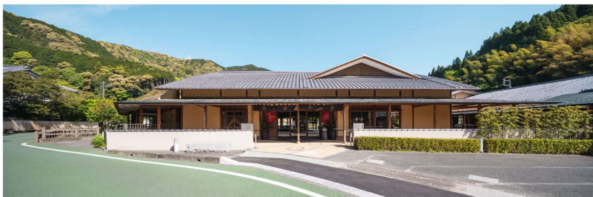
駿府の工房 匠宿外観

そして現在、駿府の工房 匠宿を中心とした匠宿エリアを、100年先の未来にも手しごとを、そして手しごとをつたえる人を残すため歩を進めています。