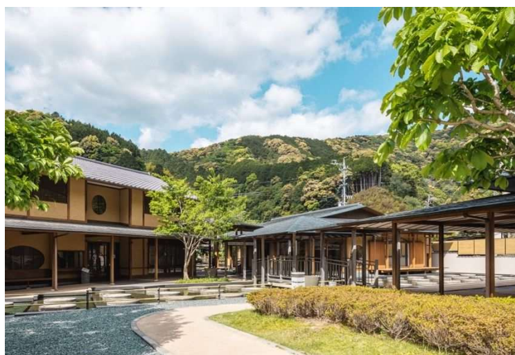
駿府の工房 匠宿中庭