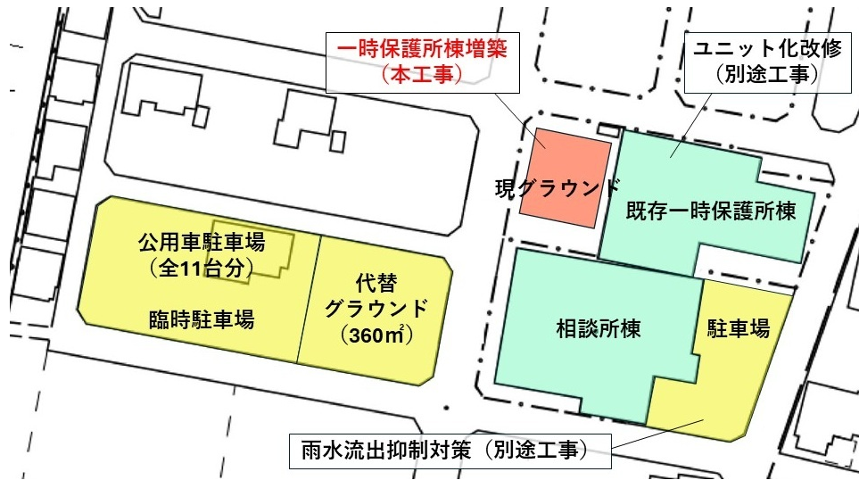
図．全体整備後イメージ