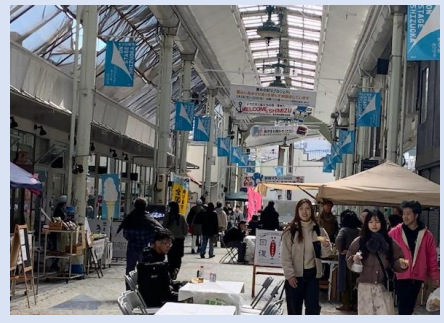
まちづくり会社主催イベント

現状・課題 清水駅周辺エリアにおいては、令和5年度にまちづくり会社が設立され、具体的な変化の兆しが見えている。また、令和6年度の業務でまちの現状・課題・目指すべきまちの姿（将来あるべき姿）を描いた。 一方で、同社の認知度や資金・人材の不足、合意形成の場である「清水のまちミライ会議」の本格的始動といった課題を抱えている。