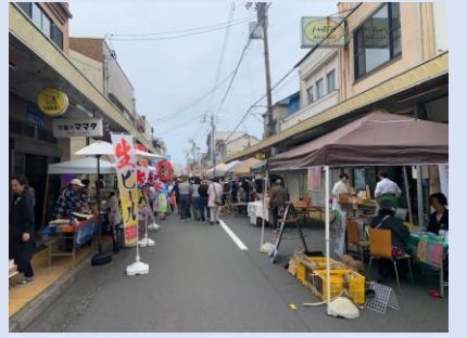
ジロチョウマーケット

現状・課題 日の出・次郎長通り周辺エリアにおいては、商店街を中心に民間発意のマルシェ等が実施され、まちづくりの機運が醸成されている。また、日の出エリアはクルーズ客船の寄港増に伴いインバウンド需要が期待される。 一方で、まちづくりへの参画者不足や、歴史的建造物の解体による街並みの消失が課題となっており、これまでの調査成果を具現化するプロジェクトの推進と、それを支える実施体制の構築が求められている。