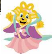
天女ピカルちゃん