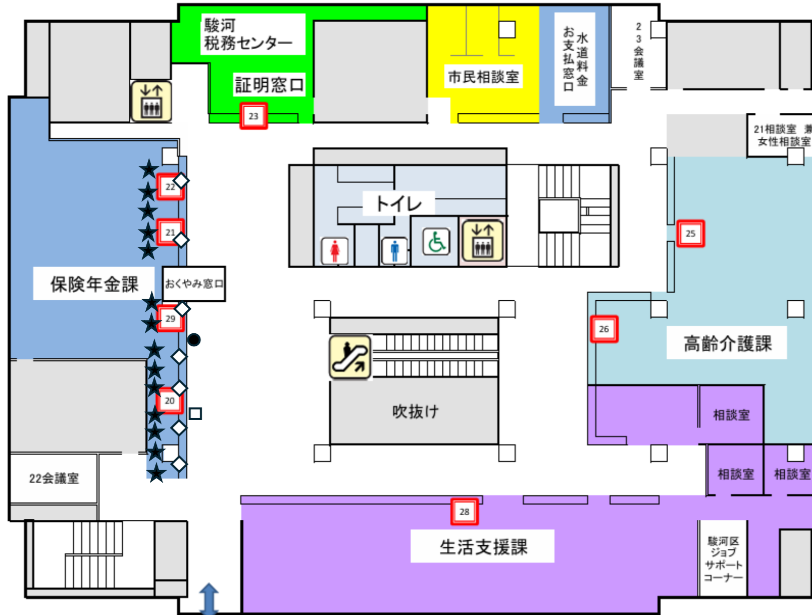
セントラルスクエア静岡 2F 連絡通路