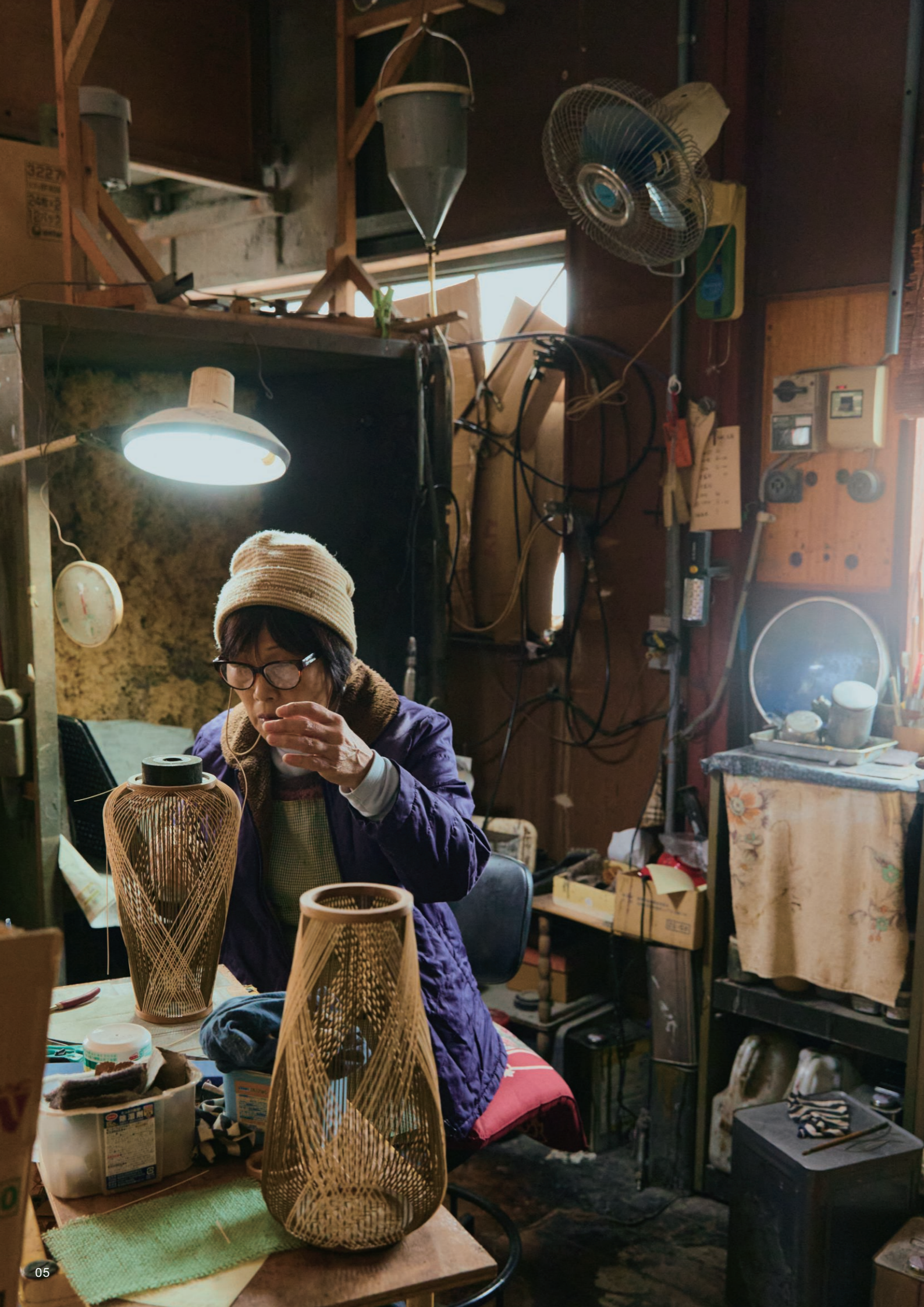
Suruga Bamboo Crafts