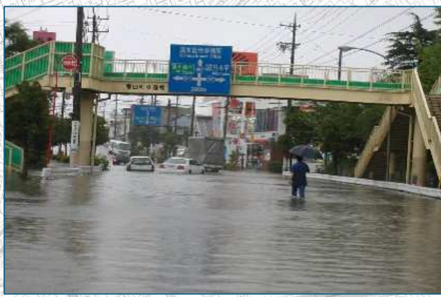
浸水状況（桜が丘公園付近）