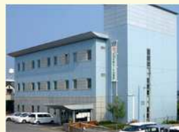
世代間交流センター (3館)