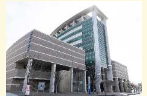
勤労者福祉センター (3館)