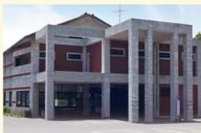
老人福祉センター (8館)