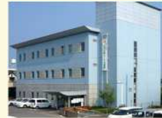
世代間交流センター (3館)