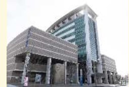
勤労者福祉センター (3館)