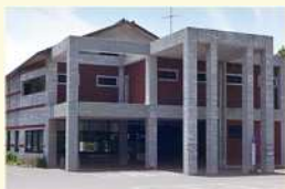
老人福祉センター (8館)