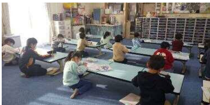
放課後児童クラブの様子