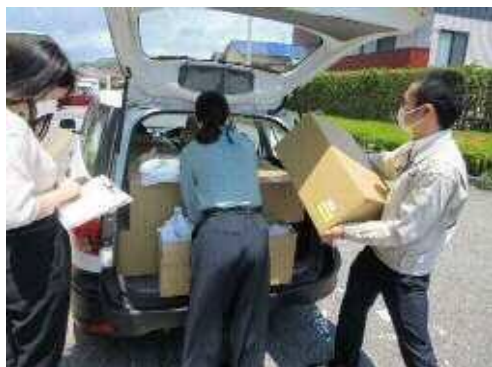
自宅療養者への物資配達の様子