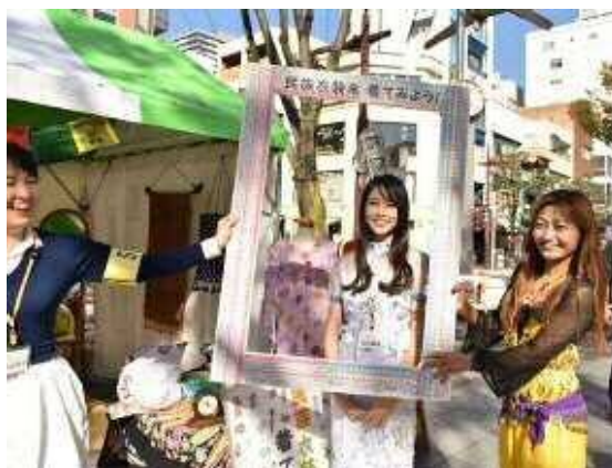
多文化共生交流体験プログラムのイメージ