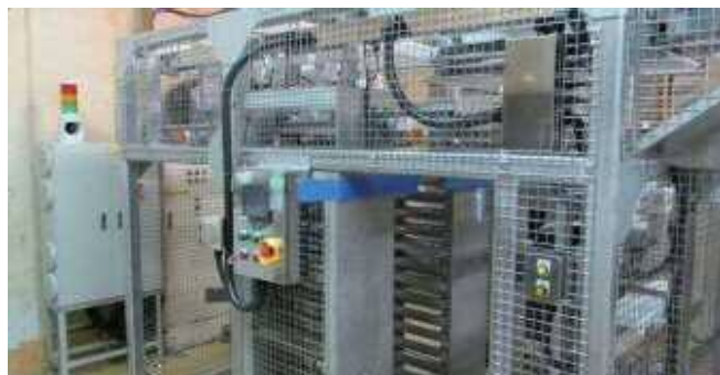
ものづくり補助金により導入する機械設備のイメージ