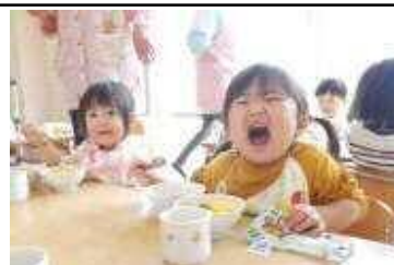
こども園での給食の様子