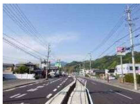
街路整備事業(静岡駅賤機線)