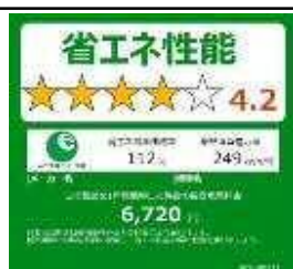
統一省エネルギーラベル