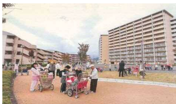
写真は富士見団地