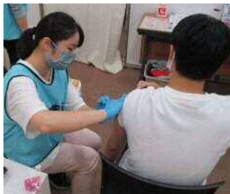
新型コロナウイルスワクチン接種