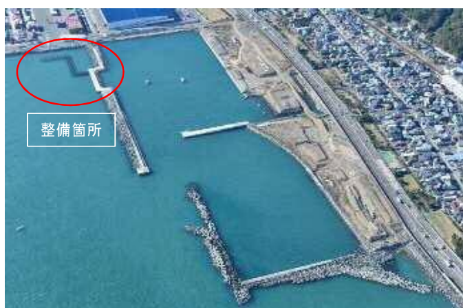
海づり施設の整備箇所(新興津地区)