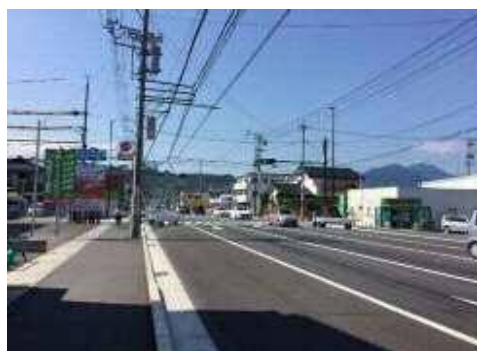
街路整備事業(宮前岳美線)