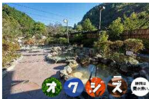
やませみの湯(清水区西里)