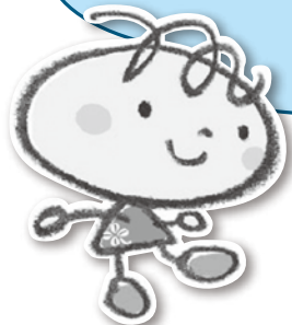
ごみ減量啓発キャラクター しずもちゃん