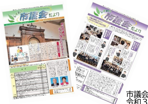
市議会だより 令和3年4月臨時会号、11月定例会号

また、議会だより点字版（総発行部数399部）を希望する方に届けているほか、録音ボランティアやまびこの協力のもと作成した声の市議会だより（CD163枚、カセットテープ125本）の貸出も行いました。