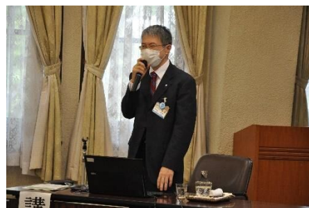
議員研修会の様子