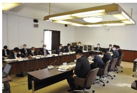
新議員研修会の様子