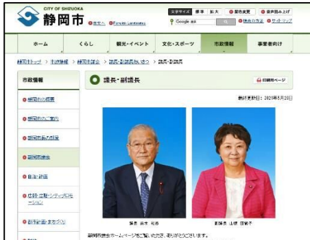
市議会HP（正副議長あいさつ）