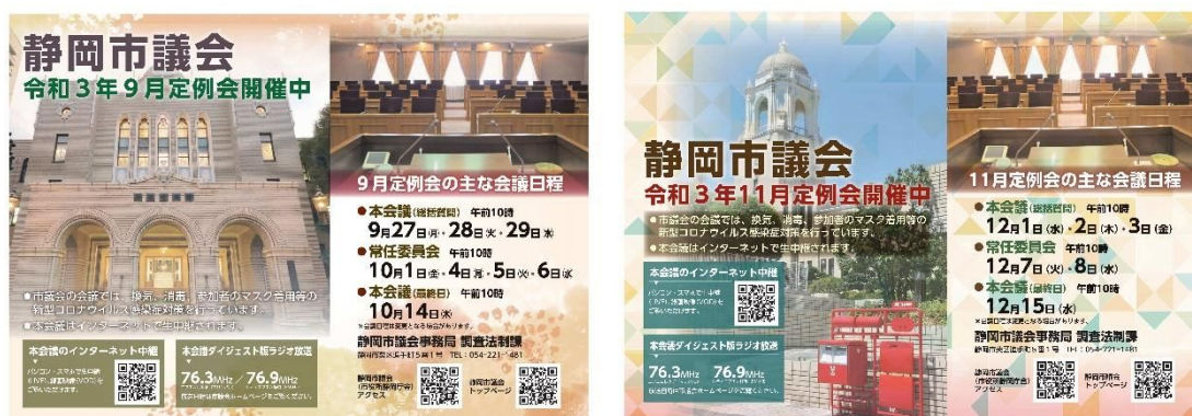
議会開催告知ポスター