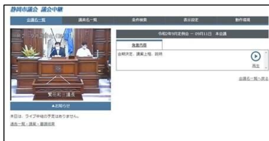
市議会インターネット中継