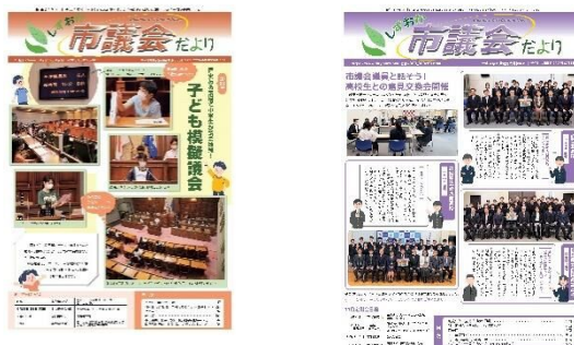
市議会だより 令和4年6月定例会号、11月定例会号

また、議会だより点字版(総発行部数293部)を希望する方に届けているほか、録音ボランティアやまびこの協力のもと作成した声の市議会だより(CD122枚、カセットテープ94本)の貸出も行いました。