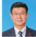
おざき ゆきお 尾崎 行雄 (2期)