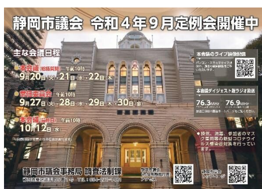
議会開催告知ポスター