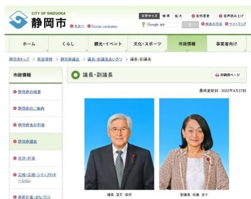
市議会HP（正副議長挨拶）