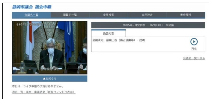
市議会インターネット中継