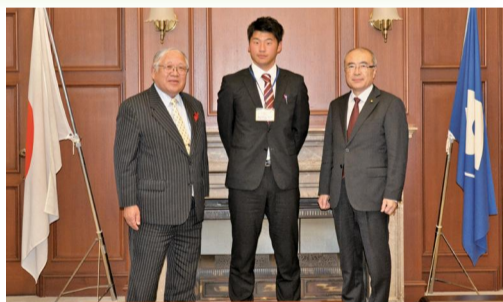
左から 議長、インターンシップ研修生、副議長

静岡市では、学生の就業意識の向上及び市政に対する理解の促進を図ることにより開かれた市政を推進することを目的に、学生に対して市における就業体験の機会を提供しています。市議会でも平成29年11月20、21、22日の3日間、今年度2回目となるインターンシップ研修生1名を受け入れました。