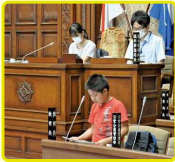
▶議員役児童からの質問に対して、市長や局長役の児童が答弁します。