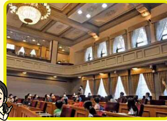
議場の歴史や設備についても学びました。