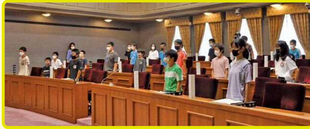
▶議員役児童による起立採決の様子。