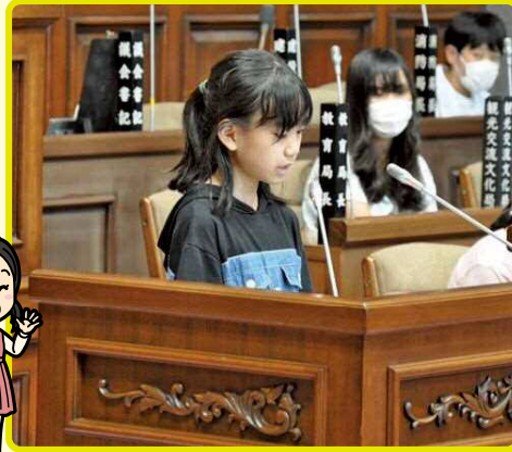
▶演壇で質問をする議員役児童。