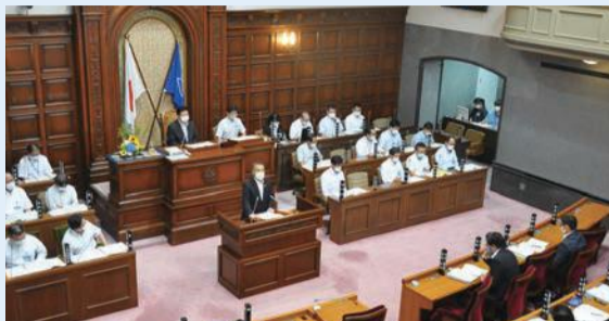
令和2年6月29日、30日の2日間、9人の議員が総括質問を行いました。質問の一部を抜粋してお知らせします。