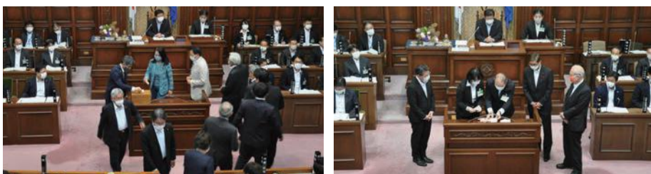
5月第2回臨時会での議長・副議長選挙の様子