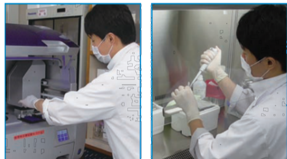
環境保健研究所でのPCR検査の様子

市民の健康と生活環境を守るため、環境保全及び保健衛生に係る検査や研究などを行う本市の行政機関。本市における新型コロナウイルス検査(PCR検査)の約3分の2を行っている。(令和2年6月時点)