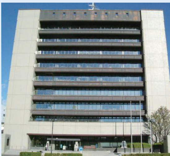
静岡市役所清水庁舎

現清水庁舎の耐震診断に係る計算過程及び診断結果は、第三者機関である静岡県建築士事務所協会の耐震評定委員会の評定を受けており、診断内容及び診断結果は妥当なものと考えている。