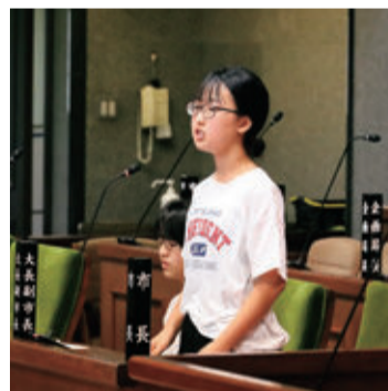
議員の質問に答える市長