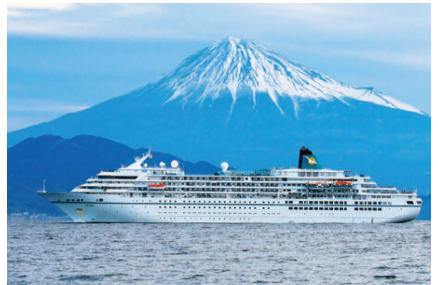
清水港に入港する外国クルーズ客船「アマデア」

A 現在、民間事業者との意見交換を通じ、事業者の様々なアイデアや意見を把握する調査を実施している。今後、その結果を参考にするとともに市民の意見を聞きながら、分別や収集方法等を検討していく。