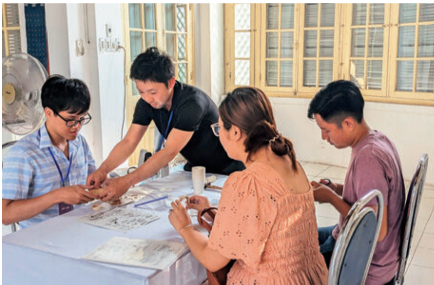
ベトナム・フエ伝統工芸祭で駿河竹千筋細工を体験する参加者

A インバウンド関連の業務の経験者や外部有識者の知識や経験を積極的に導入し、インバウンド向けの戦略を策定するための組織を立ち上げる。その中でマーケティングに基づき、ターゲットを選定し、基本戦略を取りまとめ、商品企画などの事業立案を進めていく。