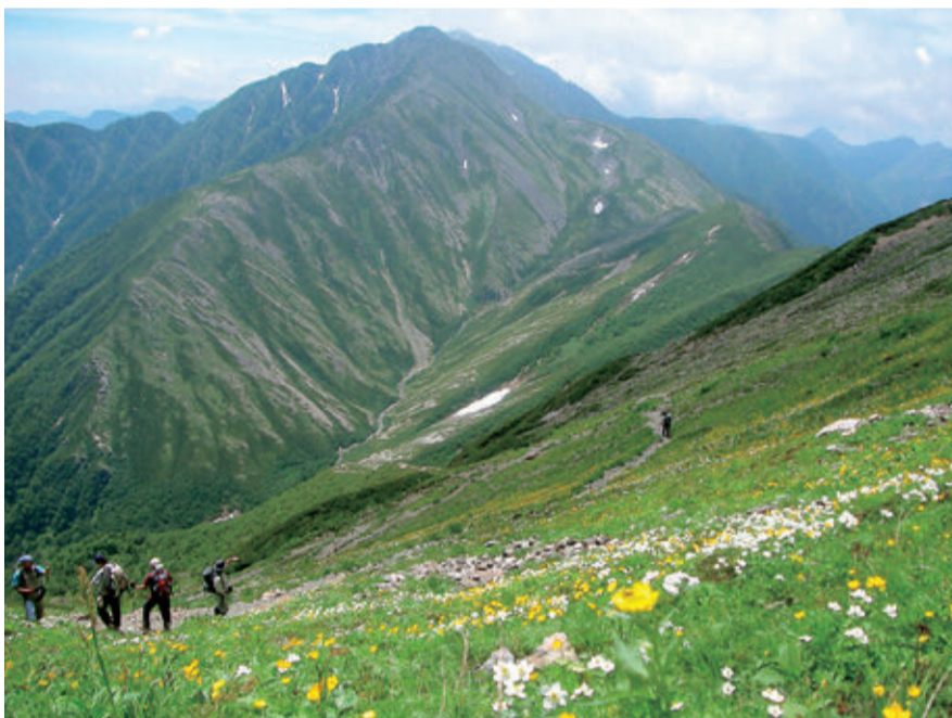
南アルプスの豊かな自然

A 人口減少問題は喫緊の課題であり、定住人口減少の傾向を変える政策を強化すべきと考える。本市の要因は、県平均より合計特殊出生率が低く、生涯未婚率が高いことが挙げられ、結婚や子どもを望む誰もが、安心感を持って暮らせる社会づくりが必要である。その他の要因も分析し、速やかに対応していく。