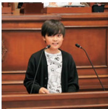
演壇に出て質問する議員