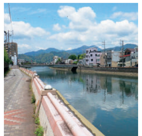
市内を流れる巴川