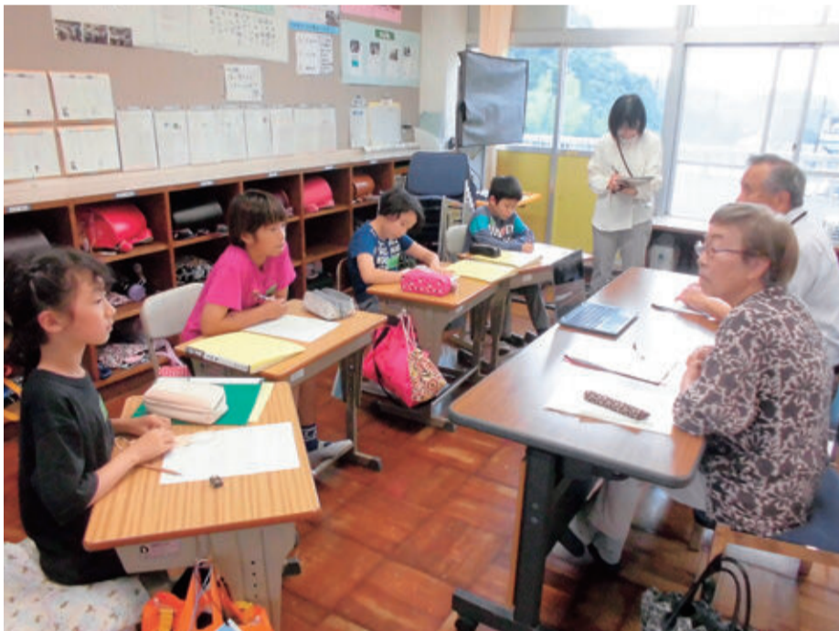
授業で地域の方々と学ぶ児童

A 本計画の対象は子どもが中心だが、6月に閣議決定された国の教育振興基本計画を踏まえると、人づくりへの積極投資と多様な人生設計に寄り添う社会システムが必要と考える。そこで、赤ちゃんからお年寄りまで全ての市民を対象として、計画を見直していく。