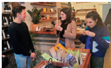
フランスで静岡市産の煎茶を楽しむ人々

日本茶の需要が高まっているフランスへの静岡市のお茶の輸出拡大に向け、現地の営業代行や情報発信などを行い、静岡市産茶の海外販路の拡大を目指します。