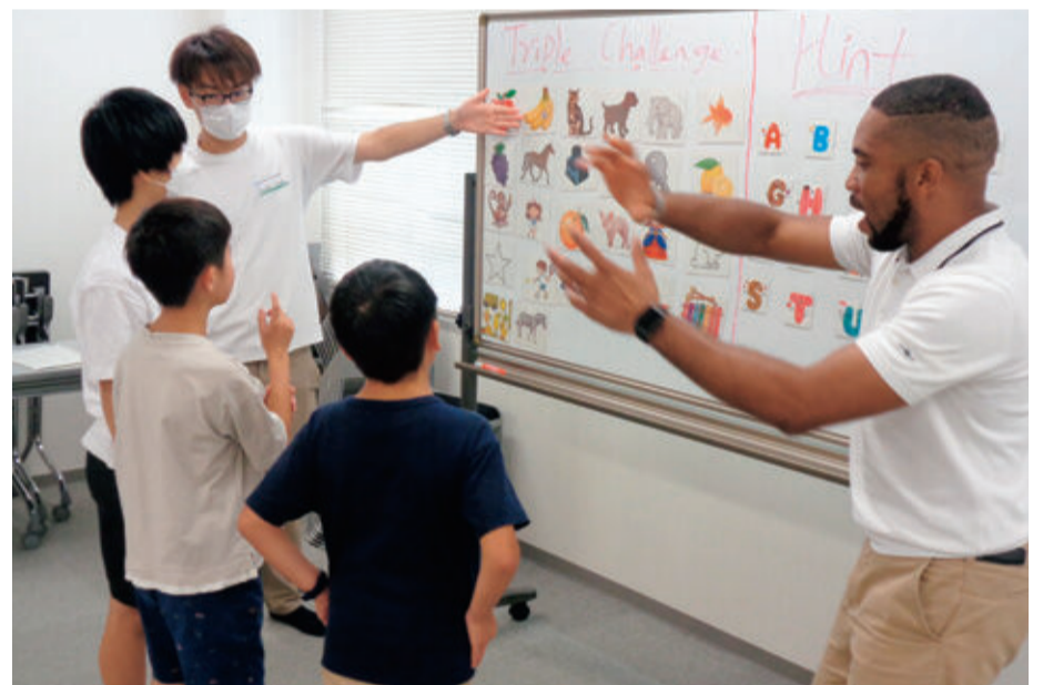
イングリッシュキャンプで英語を使って活動する ALT と児童生徒

A 高部地区の治水対策では、流量を増やし、安全に水を流すため、大内川の整備を行った。また、押切や能島のほか、地区の小学校に、河川への流出を抑える雨水貯留施設を整備した。5年度からは新たに大内新田地区に、公園や生涯学習交流館と一体となった雨水貯留施設の整備を進めている。