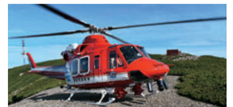
平成19年度に導入された現在の消防ヘリコプター

航空消防活動の維持や災害対応能力の強化を目指します。標高3,200mの山岳地で、要救助者を2名以上救助できるようになります。