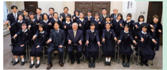
12月22日開催 静岡雙葉高校