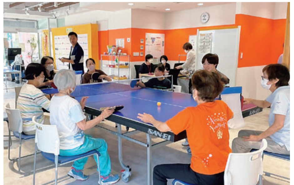
かけこまち七間町での健康卓球教室

A 公共施設の統廃合により生じる跡地の処分・活用に係るルールに基づき、施設の売却や活用に取り組んできたが、未だその事例はない。売却や活用を積極的に進め、新事業の原資とすることが重要である。企画局内に専門的に実施する職員を配置し、新制度の検討等を行っており、これまでのルールに代わる方針等を構築し、実効性の高い取組を進める。