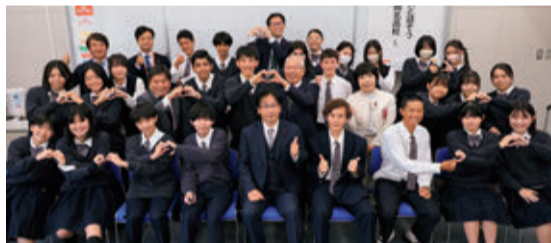
11月9日開催 静岡北高校