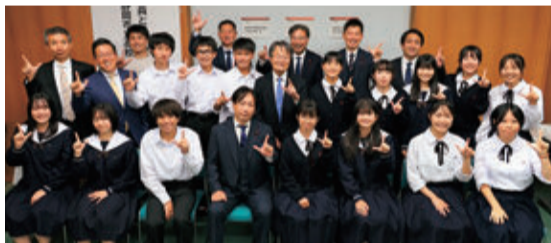
11月8日開催 静岡市立高校