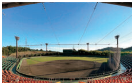
改修予定の庵原球場

プロ野球の公式戦が開催できるように、プロ野球ハヤテ球団の本拠地となる清水庵原球場を改修します。