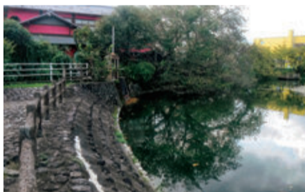
排水ポンプが設置される弁天池

防災調整池に強制排水ポンプを新設することで貯留機能を強化し、大雨時の浸水被害の軽減を図ります。