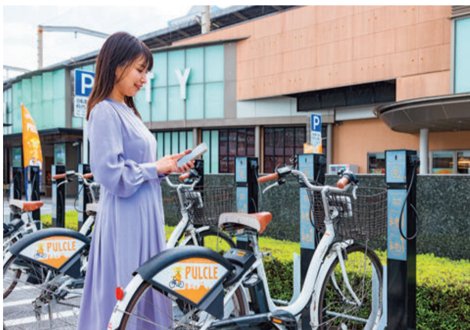
市内に設置されているパルクル

A 社会情勢を見ると、基本方針などを見直す時期だと考える。施設の複合化などを進め、より質の高い効率的なサービスを提供できる場合は、積極的に民営化を検討する。また、建物だけでなく小中学校跡地などについても、民間活用を積極的に進める。