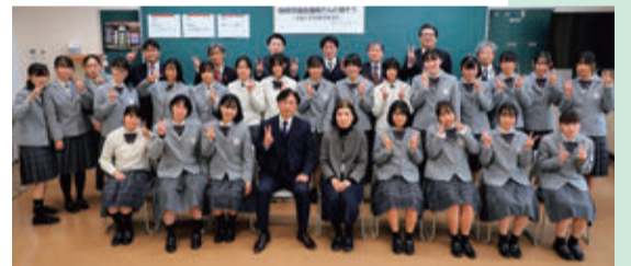
12月19日開催 常葉高校