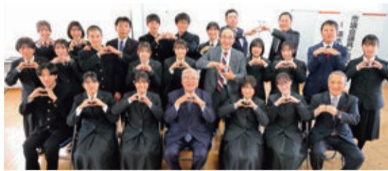
12月21日開催 清水桜が丘高校