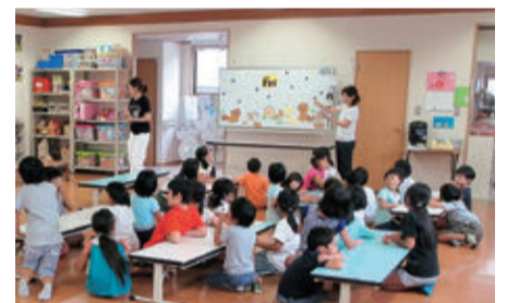
市内の放課後児童クラブ

山間部の小学校における子どもの安全な居場所の確保とサービス向上のため、放課後子ども教室と放課後児童クラブを一体的に運営します。