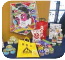
▲新たに認証された商品

市では、市民投票で選ばれた商品を、新たな地域ブランド「しずおか葵プレミアムAWARD」として広くPRし、本市のシティプロモーションにつなげていく取組を進めています。