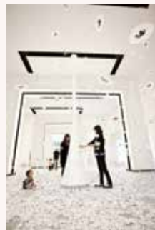
2010年当館での展示の様子