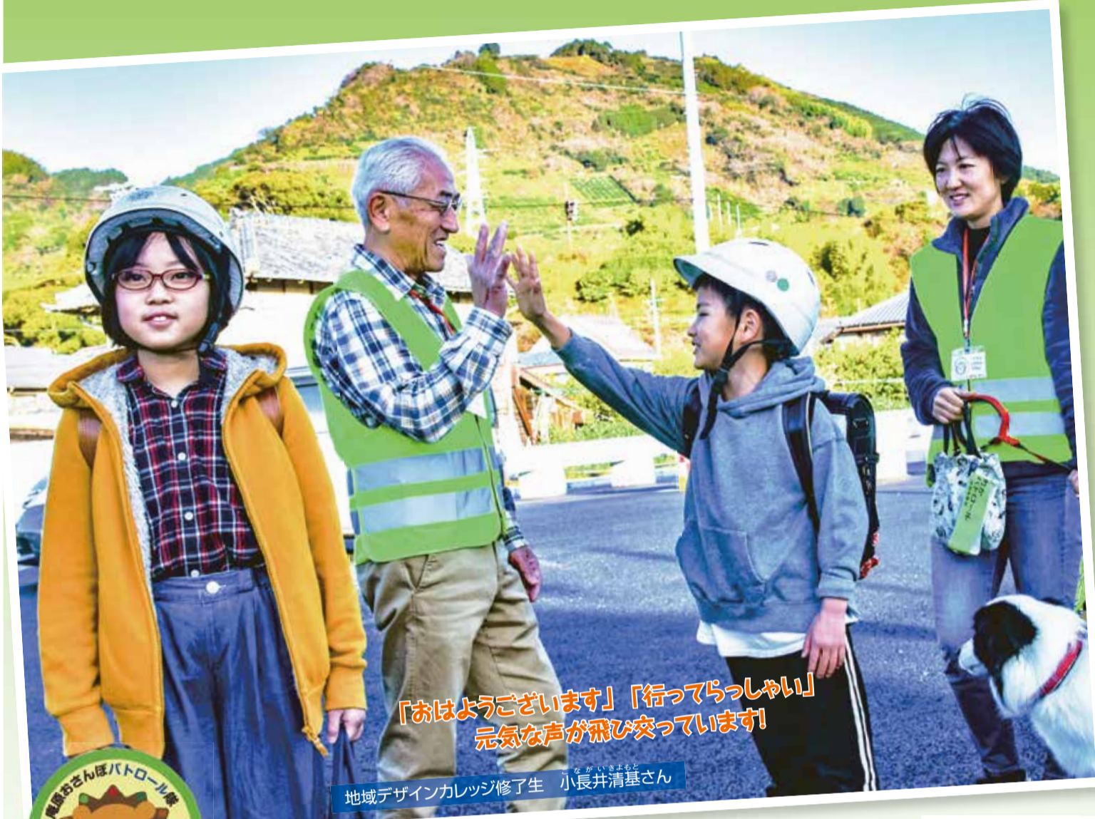
「おはようございます」「行ってらっしゃい」 元気な声が飛び交っています!