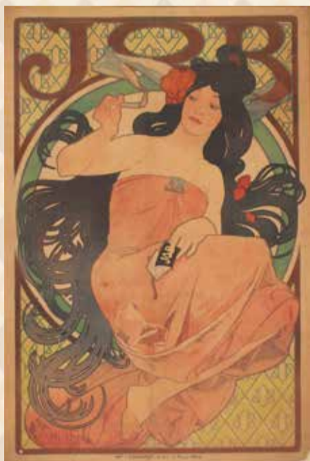
アルフォンス・ミュシャ「[ジョブ]ポスター」1898年、三重県立美術館