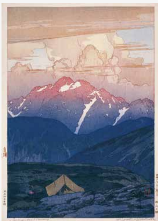
▲吉田博「日本アルプス十二峰 劔山の朝」大正15(1926)年