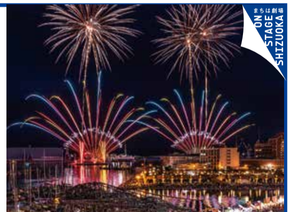
※前回の様子