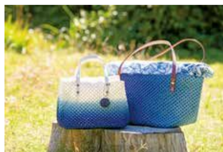
▲藍で染めたペーパーコードを使ったバッグ

私の家は以前、藍染め着物を専門としていましたが、時代と共に需要が減ったことで、今の人が普段の生活で使うものの染色へと転換しました。また、新型コロナウイルスの影響により、展示会など直接作品を見て買ってもらう機会が減ったため、現在はインターネットを通じた販売もしています。藍で染めるものも、レザーやペーパーコード、木など布以外にも広げ、藍で染めた和紙を使った一閑張りにも挑戦しています。