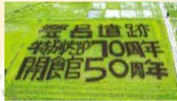
復元水田での田んぼアート

登呂遺跡特別史跡指定70周年、登呂博物館開館50周年記念事業を実施しました(5/14~)