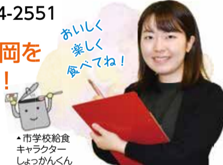
◆市学校給食キャラクター しよっかんくん

たとえば、11月に提供した「桜えび」と「お茶」を使ったかき揚げでは、食材の味を残しつつも子どもが「食べにくい」と感じるほどの苦味になっていないか、給食センターの機械で揚げるときにくずれない硬さか、かき揚げの中心まで火が通る厚さかなど、細かい部分まで配慮しました。また、子ど