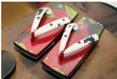
▲猫のデザインをあしらった染め下駄

駿河塗下駄には大きく分けて伝統的な漆塗りのものと、染料を使った染めのものの2種類があります。漆塗りのものは、完成までに50工程ほどあり、中には完成までに1年以上かかるものもあります。染めものは漆塗りに比べると歴史が浅く、今作っているものは、師匠である父が考案したもので、色合いを通して国産の桐の美しい木目を楽しめます。漆のものは卵の殻を使った卵殻細工を施し、昔ながらの絵柄を表現することで伝統工芸品として魅力と人気がある一方、染めものは犬や猫、パンダといった自由でポップな絵柄を表現することで、現代の洋服でも履きこなせるカジュアルさがあり、最近注目されています。