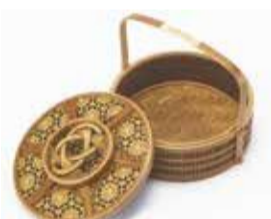
▲淡路手付き丸菓子器