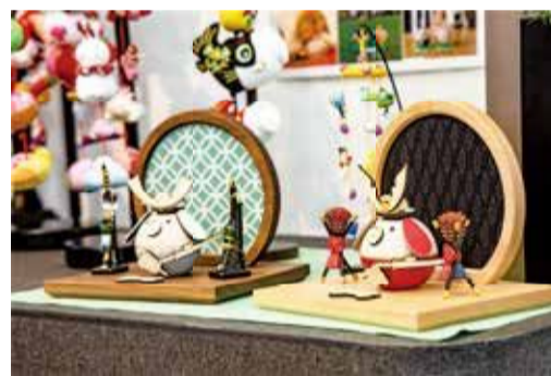
▲ペットとの記念日を祝う人形

このような状況では、職人たちは地場産業で生計を立てていくことは難しく、新たな担い手も出てこないため、後継者不足に陥っているのは間違いない事実です。