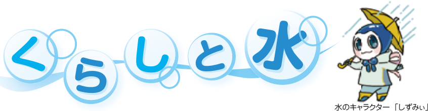
水のキャラクター「しずみい」