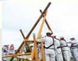
水防演習の様子(水防工法の実演)