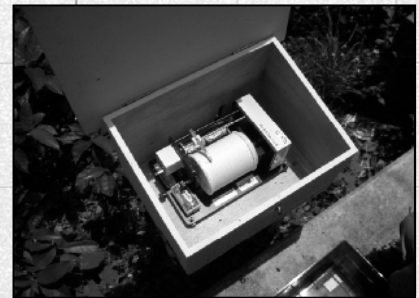
観測計器点検状況