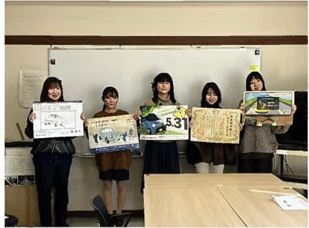
1月25日審査結果の発表後の記念撮影