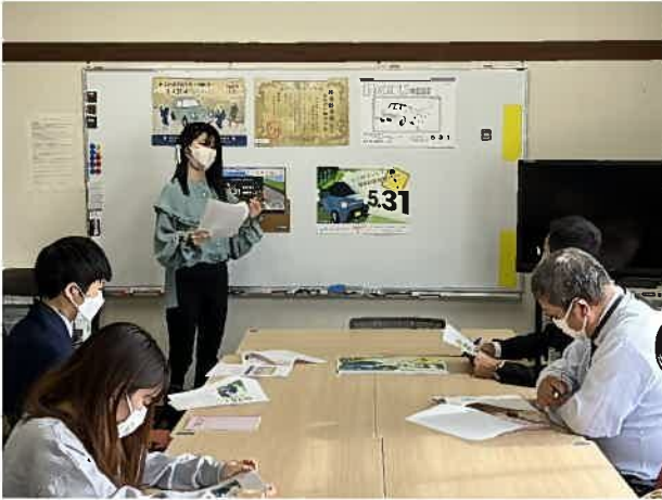
11月30日ポスタープレゼンテーション