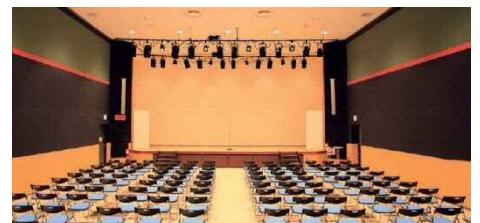
参考：会場の様子(MIRAIE リアン 七間町)