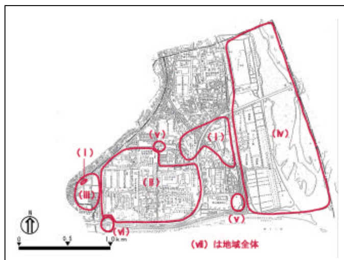
東部地域の課題ポイント図