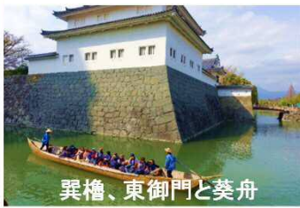
翼櫓、東御門と葵舟

お堀や石垣、水辺、緑が醸し出す歴史文化や風格を優先し、 整備する施設類は空間の中で主張せず、かつ駿府城跡という 場所にふさわしい高質的なデザイン、色彩を採用します。