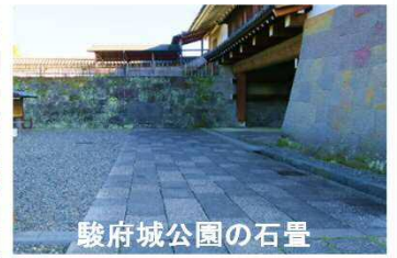
駿府城公園の石畳