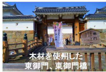
木材を使用した 東御門、東御門橋