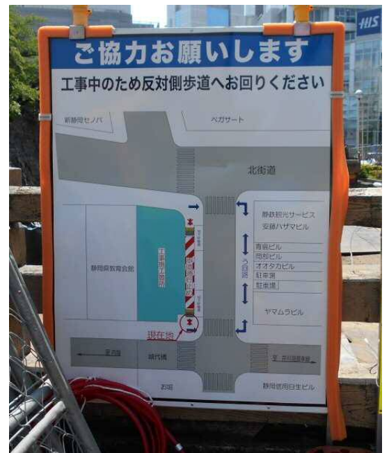
工事中は外堀沿いの歩道が通行止めになり、ご迷惑をおかけしますがご協力をお願いします。