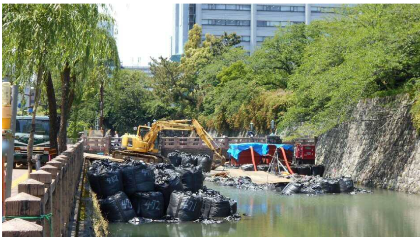
水辺デッキの設置に向けて、お堀の水抜き作業が始まりました。