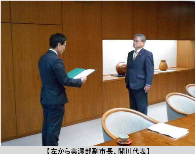
【左から美濃部副市長、関川代表】